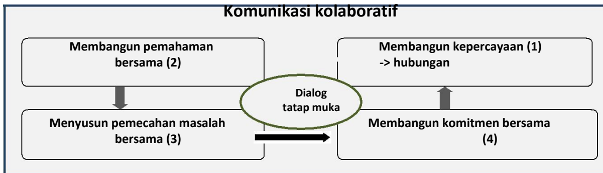
Gambar 2. Komunikasi Kolaboratif terjadi melalui dialog tatap muka

Upaya membangun hubungan dilakukan dengan hubungan timbal balik diantara para pemangku kepentingan, yang berarti adanya saling memberi dan menerima diantara mereka. Hal ini terlihat dalam hal, ketika proses konsultasi publik, perwakilan dari BKSDA sebagai lembaga yang bertanggung jawab terhadap kelestarian kawasan memfasilitasi terjadinya diskusi dengan para pemangku kepentingan. Mereka memperhatikan apa yang diusulkan oleh LSM yang tergabung dalam gerakan save ciharus , terbukti dengan disetujuinya beberapa hal yang disampaikan oleh LSM, tentang kejelasan batas kawasan, penambahan papan pengumuman kawasan dan memperketat penjagaan kawasan konservasi. Selain itu, perusahaan geothermal Pertamina memberikan bantuan untukantisipasi kerusakan hutan berupa reboisasi, restorasi, dan penyelamatan habitat burung elang.